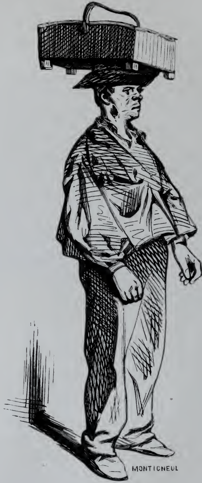
L'Allumeur de Réverbères.